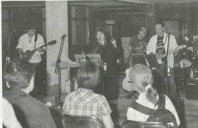
バンドグループ「キャサリン」による演奏=旧五個荘支所前庭(東近江市五個荘竜田町)で

演奏を披露したのは、同市内でライブ活動をしているバンドグループ「キャサリン」の7人。軽いトークやジョークで会場を盛り上げながら、「ト」などのトトロや「木綿のハンカチーフ」「ハナミズキ」といったポップス、ベンチャーズメドレーなど12曲を演奏。女性ボーカリストの伸びやかな歌声が、夜気のしじまに響き渡り、来場者は静かに耳を傾けていた。同時刻、近くの小幡町で雅楽演奏会も催された。